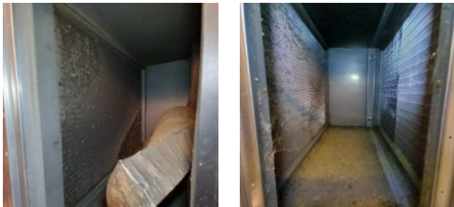
Verunreinigungen & Schmutz